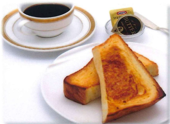
“ボローニャ” トーストセット