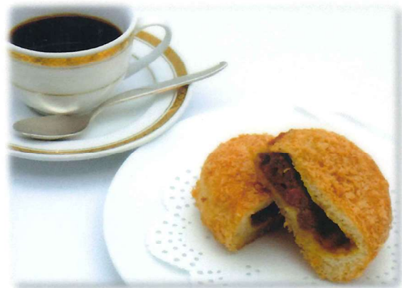
“揚げたて” カレーパンセット