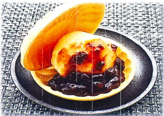
小倉アイスもなか